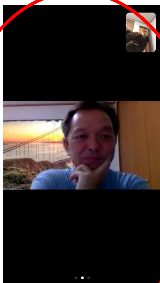
スピーカービュー